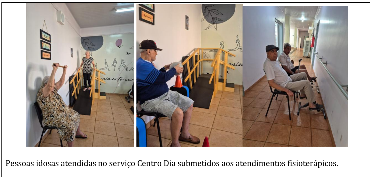
Pessoas idosas atendidas no serviço Centro Dia submetidos aos atendimentos fisioterápicos.