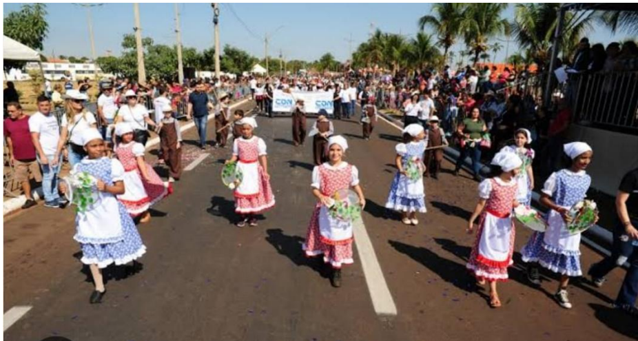
(Imagem meramente ilustrativa)

2.2. Casal de Camponeses (Destaques de Chão): 10 casais de alunos da rede municipal representando a colheita tradicional e as raízes agrícolas do município. O figurino feminino é composto por um vestido de camponesa com estampa floral ou xadrez em tons de azul, branco ou vermelho, acompanhado de avental branco frontal e lenço de cabeça coordenado. O figurino masculino consiste em macacão ou calça de brim em tons de marrom ou terra, camisa de mangas longas e chapéu de palha. Como acessório, ambos portam peneiras de palha decoradas com grãos cenográficos de arroz e milho, simbolizando a fartura da colheita histórica.