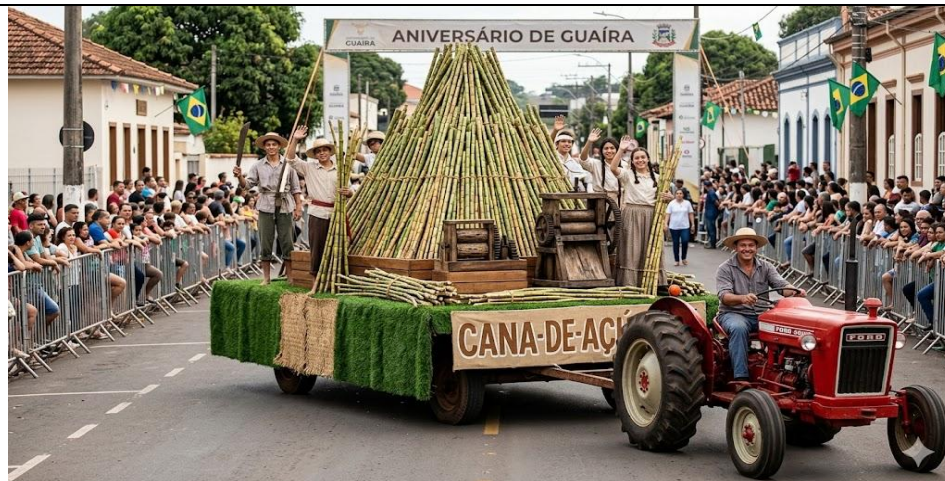
(Imagem meramente ilustrativa)

4.2. Casal de Camponeses (Destaques de Chão): 10 casais de alunos da rede municipal representando a força do trabalho nos canaviais e a cultura popular da região. O figurino feminino é composto por um vestido de chita com estampas florais vibrantes em tons de vermelho e branco, apresentando mangas bufantes, gola redonda e acabamento em babados com renda na barra, além de um avental branco sobreposto e lenço de cabeça (touca) coordenado com a estampa do vestido. O figurino masculino consiste em uma camisa xadrez de padronagem miúda em tons de vermelho e branco, sobreposta por um macacão de brim azul com detalhes de botões decorativos, finalizado com um lenço vermelho triangular atado ao pescoço. Como acessórios de lida, os alunos portam feixes cenográficos de cana-de-açúcar.