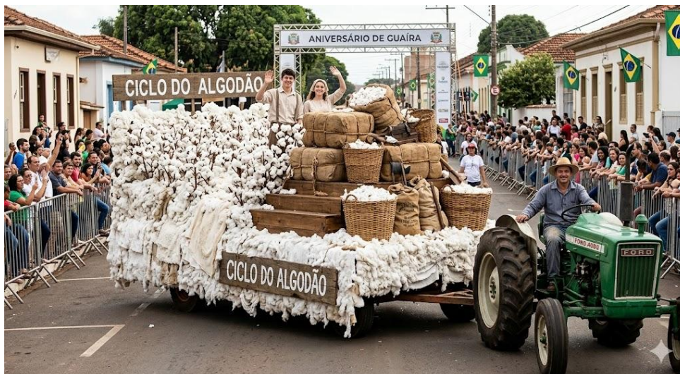
(Imagem meramente ilustrativa)

a memória da produção agrícola de Guairá com réplicas de fardos empilhados e cestarias de época, reforçando a importância histórica deste ciclo econômico para o município. A frente do veículo porta faixa de identificação rígida com os dizeres: "CICLO DO ALGODÃO".