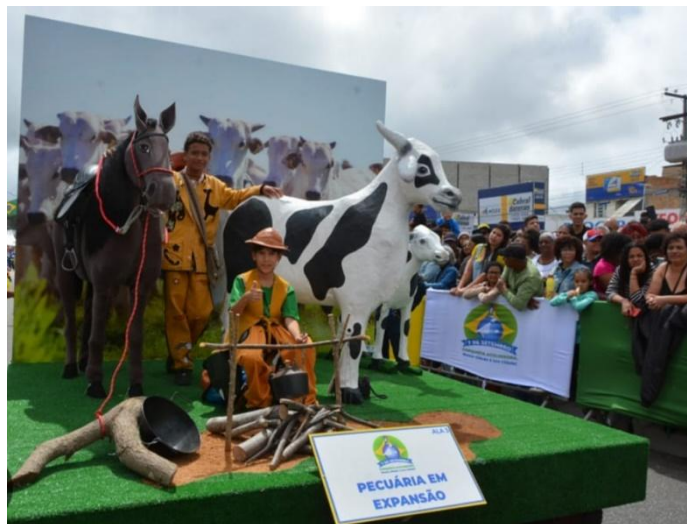
(Imagem meramente ilustrativas)

1.1.Casal de Camponeses (Destaques de Chão): 10 casais de alunos da rede municipal representando o homem e a mulher do campo e as raízes da pecuária local. O figurino feminino é composto por um vestido camponês com estampa em xadrez azul e branco, apresentando detalhe de avental branco frontal, mangas bufantes e chapéu (boné/touca) coordenado no mesmo padrão do tecido. O figurino masculino consiste em uma camisa de mangas longas em padronagem listrada miúda, calça em tecido brim azul de corte reto, suspensórios pretos e lenço vermelho triangular atado ao pescoço. Como acessórios de lida rural, a ala utiliza cestos de vime com palha para as figuras femininas e baldes metálicos estilizados com botas pretas para as masculinas, reforçando a caracterização histórica do setor.