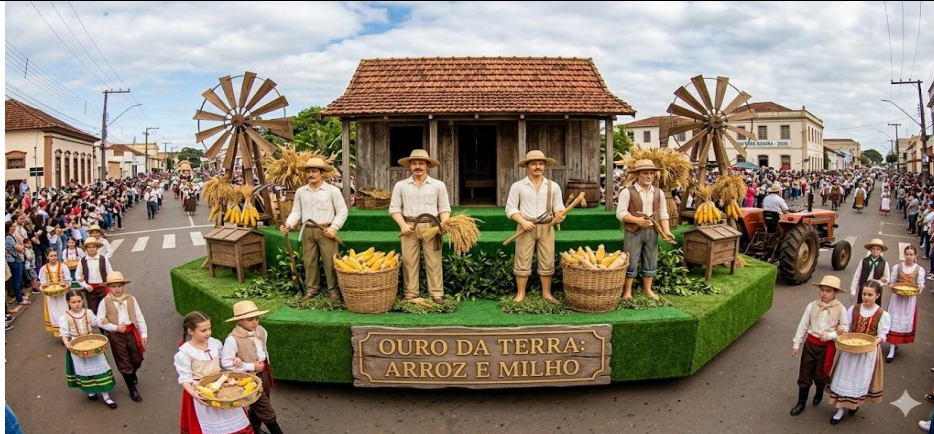
(Imagem meramente ilustrativa)

2.2. Casal de Camponeses (Destaques de Chão): 10 casais de alunos da rede municipal representando a colheita tradicional e as raízes agrícolas do município. O figurino feminino é composto por um vestido de camponesa com estampa floral ou xadrez em tons de azul, branco ou vermelho, acompanhado de avental branco frontal e lenço de cabeça coordenado. O figurino masculino consiste em macacão ou calça de brim em tons de marrom ou terra, camisa de mangas longas e chapéu de palha. Como acessório, ambos portam peneiras de palha decoradas com grãos cenográficos de arroz e milho, simbolizando a fartura da colheita histórica.