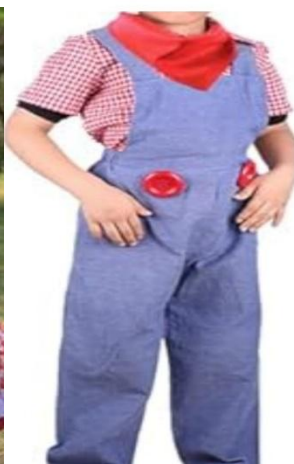
(Imagem meramente ilustrativa)